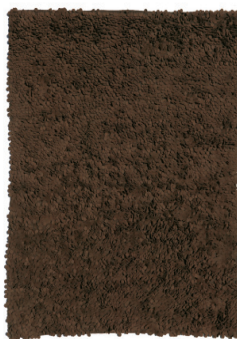
Marrón · Brown