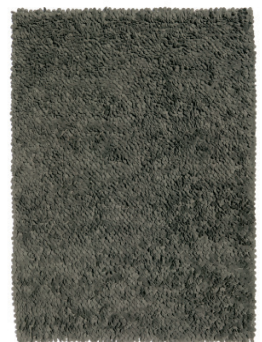
Gris · Grey