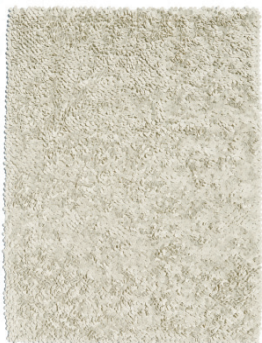
Crudo · Ivory