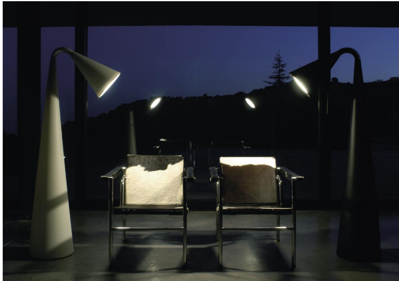
Casa Ribas - Alella

Formas redondeadas, cuerpo alargado, flexibilidad y sobriedad. Estilizada y elegante, la lámpara Camp se orienta hacia cualquier lugar donde sea necesaria una iluminación concentrada. Un cono grande y otro más pequeño se unen mediante un cuello flexible para garantizar una posición estable pero que permita dirigir el haz de luz en cualquier dirección. Round shapes, a long body, flexibility and sobriety. Slender and elegant, the Camp can be directed anywhere a concentrated amount of light is needed. Comprised of a large cone fused together with a smaller one by a flexible neck, the lamp guarantees a stable position from which a beam of light can be pointed in any direction.